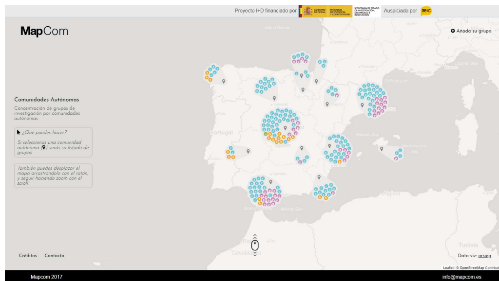
Imagen 1: Mapa interactivo 3 de grupos por Comunidad autónoma.