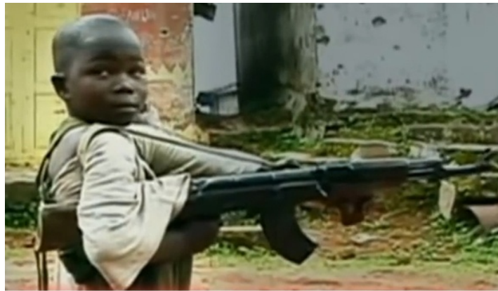
Figura 2. YouTube. Se brotar no Manguinho, nós vai matar polícia (vídeo) 6

La apología del crimen se delinea como terreno discursivo por el cual circulan las narrativas de la violencia programática, y presenta una versión simplificada de los conflictos sociales que atraviesan el mundo del crimen, basada en binomios dentro-fuera, hermano-enemigo, reliquia-verme, mundo del crimen-sociedad, estructurado-antes del comando. Los juegos de sentido propuestos en la apología del crimen son como alternativas de formas de vida para quienes adhieren a los comandos, obteniendo protección física y empoderamiento psicológico, afiliación social, justificaciones que prometen legitimar el involucramiento en actividades ilegales y violentas, un culpable para el dolor, un enemigo contra quien luchar: “No somos 'ilegales' porque la Ley quien la hace somos nosotros”. (YouTube, Faixa de Gaza, vídeo) 7 .