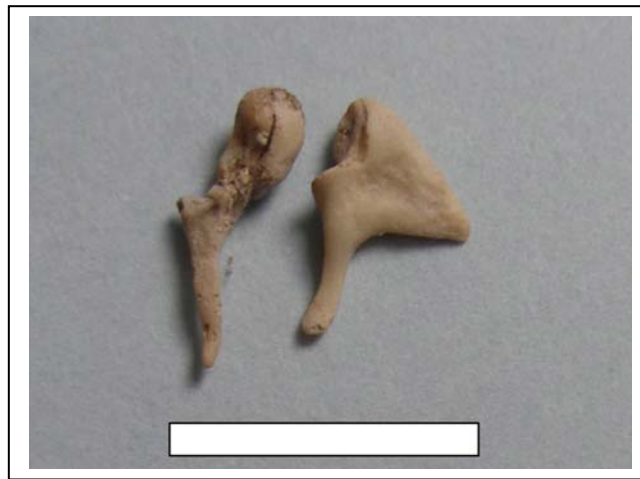
Figura 4.- Martillo y yunque

Yunque y martillo del derecho (Figura 4), y parte del anillo timpánico.