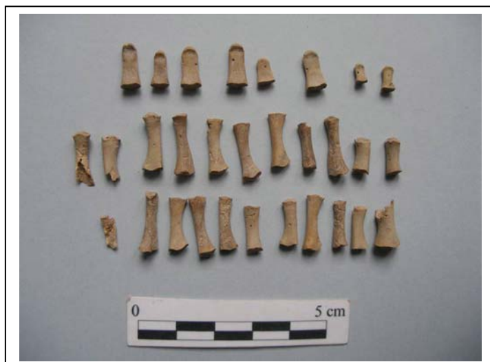
Figura 10.- Restos de manos y pies.