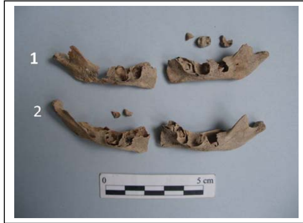
Figura 7.- Restos mandibulares de ambas inhumaciones