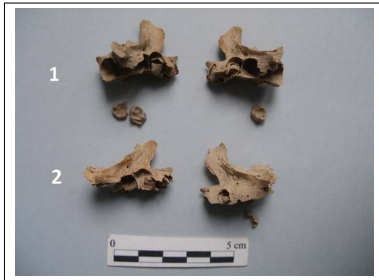
Figura 6.- Maxilas de ambos individuos

Hemimandíbula izquierda casi completa (Figura 7).