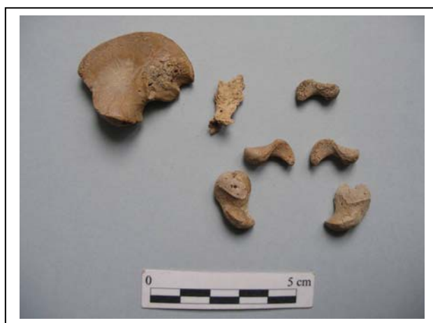
Figura 9.- Restos de pelvis.

Medidas: Longitud máxima derecho: 17'4 mm. Longitud máxima izquierdo: 16'6 mm. Longitud máxima izquierdo: 15'1 mm