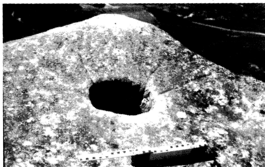
Lámina I: 1. Bloque arenisco donde se localiza el grabado, desde el norte. 2. La laja con el grabado, desde el este. 3. Detalle del grabado