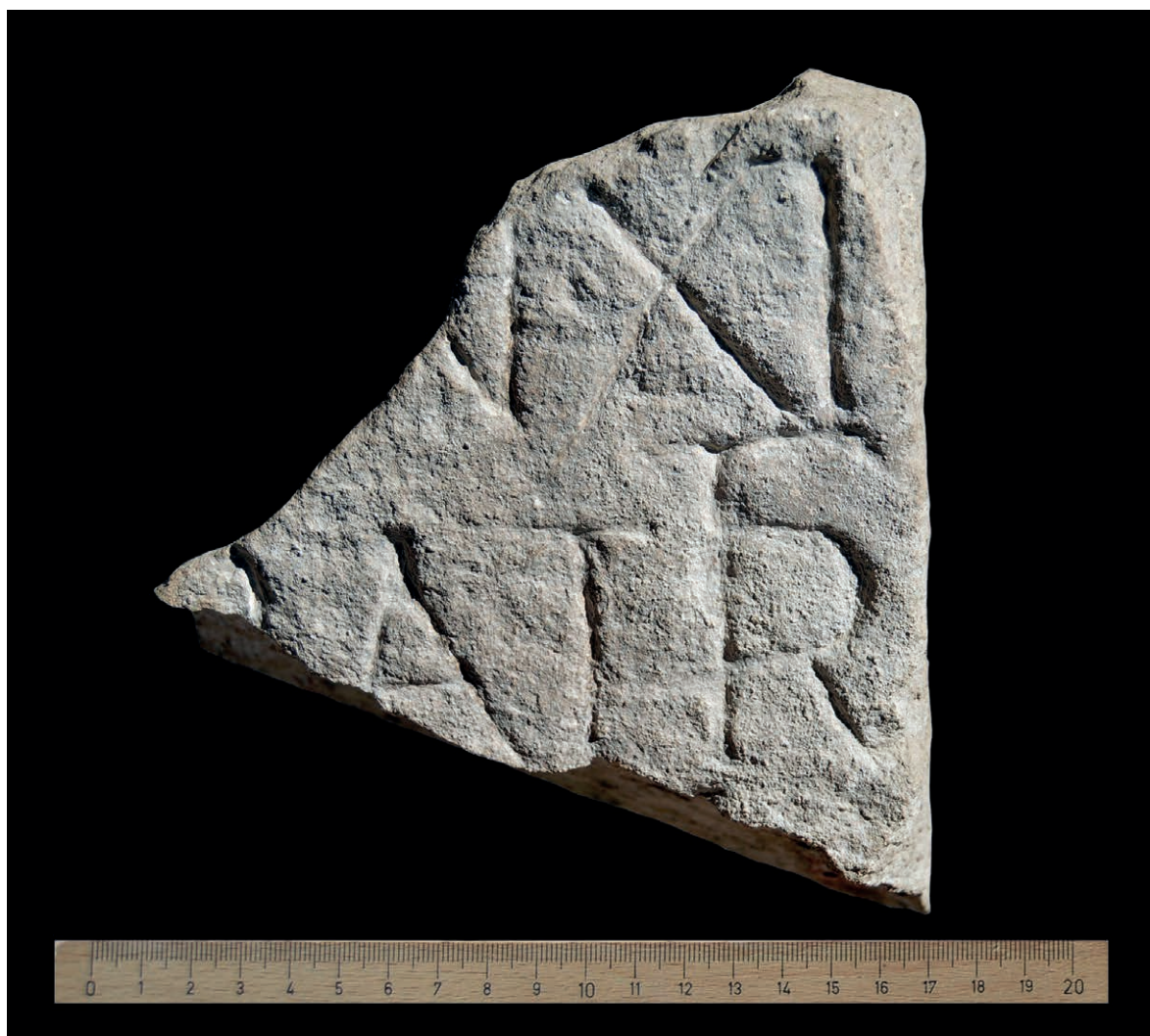
Figura 16 Fragmento de epígrafe funerario, n.º 6.2

da. En la línea 1 se conserva una interpunción circular. El nexa ER tiene una altura de 7 cm. De una tercera línea solo se conserva el vértice superior de una letra (Figura 16).