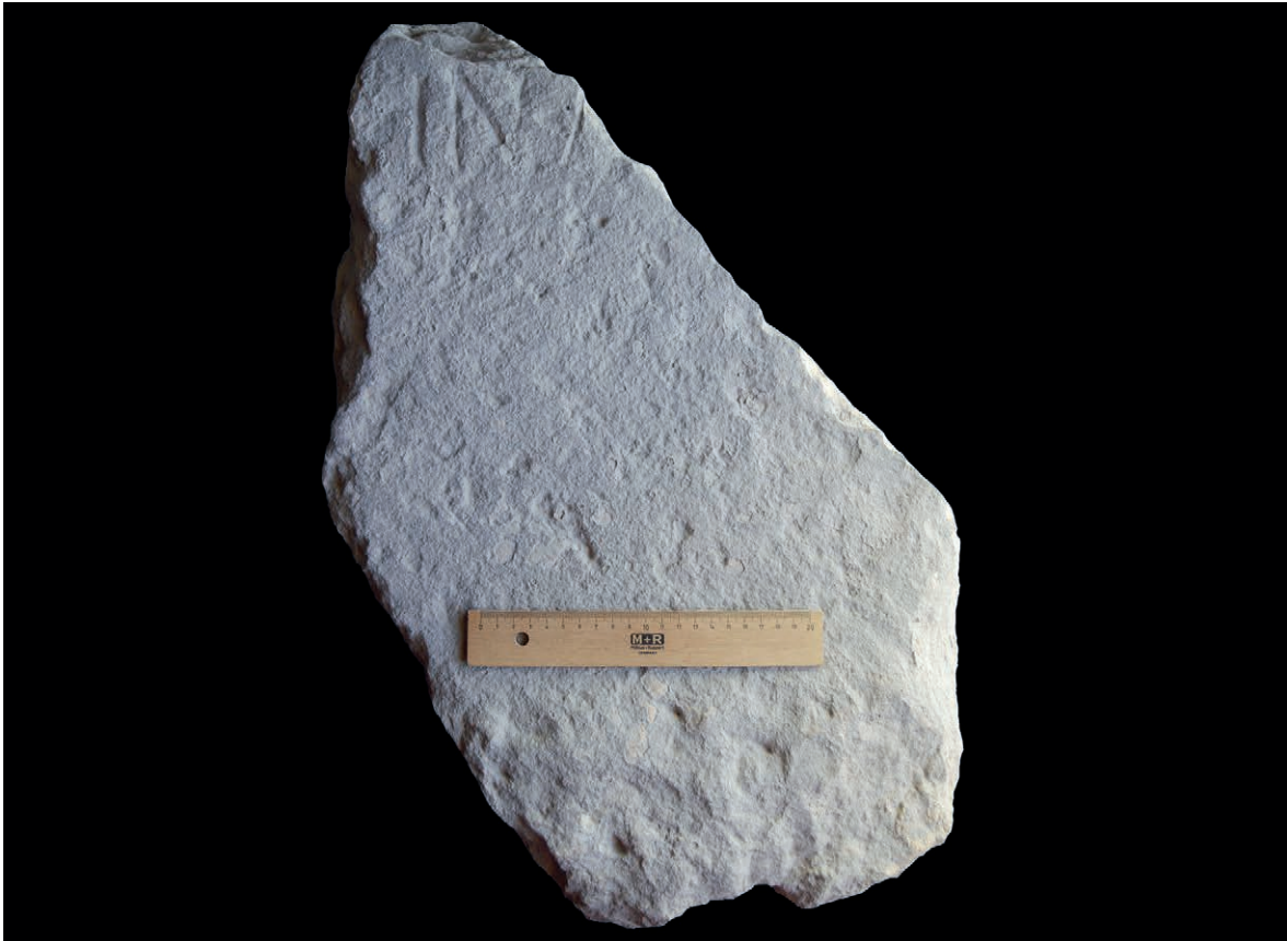
Figura 5 Fragmento de cipo funerario, n.º 1.5