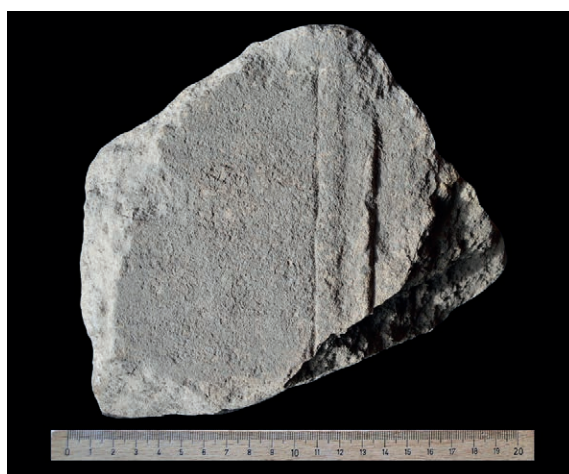
Figura 7 Fragmento de epigrafe indeterminado, n.º 1.7