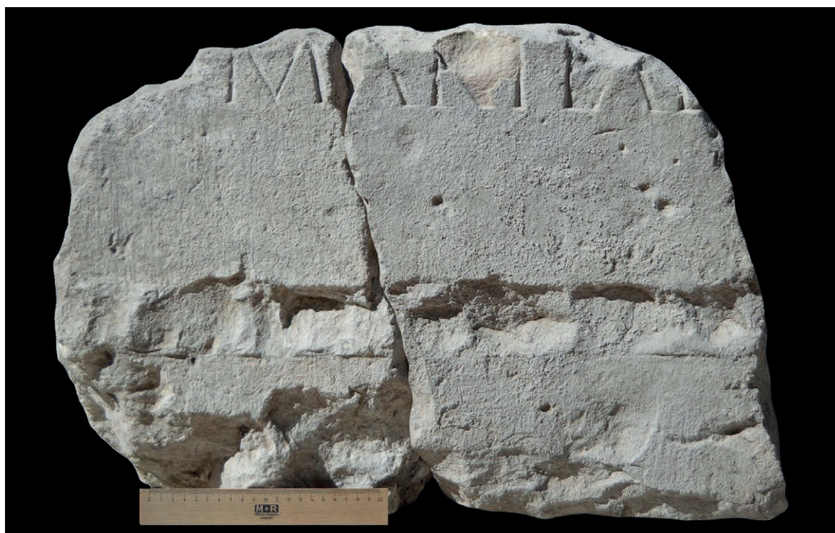
Figura 3 Epistilo de obra pública, n.º 1.3

Se trata de dos fragmentos de un arquitrabe tallado en la caliza local procedente de las canteras de Diana, que pegan entre sí. Conserva original la cara inferior y parte de la cara superior y lateral izquierda, que están alisadas. Sus dimensiones son 45 \times (67,5) \times (32) cm. Presenta los restos de la talla de una moldura en la cara frontal, que recorrió toda la longitud del bloque. Se trata de un astrágalo de 6 cm de altura, situado a 13 cm de la cara inferior. La única línea de texto conservada comenzó a cincelarse a 15 cm del lateral izquierdo del bloque y las letras midieron 7 cm de altura. Letra capital cuadrada, de buena factura. La pieza presenta numerosos golpes, que afectan a algunas de las letras, y pérdida de lascas de la piedra en la moldura y la parte inferior de la cara frontal. Se conserva en el Museo de Segóbriga (Figura 3).