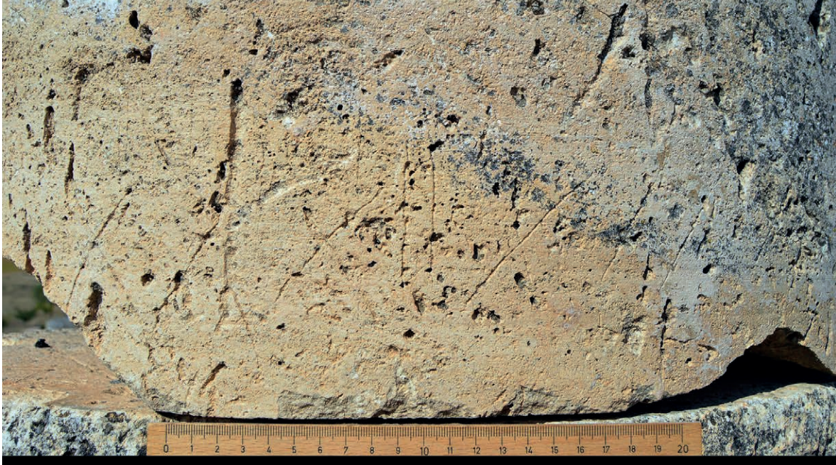
Figura 8 Columna con grafitos procedente del foro, n.º 2.1

Se trata del fragmento inferior de un tambor de columna tallada en piedra caliza local. La columna conserva una altura de 46 cm y su diámetro es de 69 cm. La altura de las letras es de 3 cm (Figura 8).