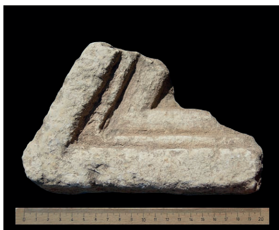
Figura 6 Fragmento de tabula ansata , n.º 1.6

Corresponde a un fragmento que conserva la cara frontal y lateral de un bloque o una estela realizada en piedra caliza local, que conserva parte de la cartela rebajada donde se cinceló el texto y la moldura que la rodeaba, de 2 cm de anchura. Esta moldura se talló a 10 cm del borde izquierdo de la pieza. La cara frontal está alisada y la cara lateral aparece desbastada. No conserva ningún trazo de letra. Sus dimensiones son (18) × (20,5) × (23) cm. Fue descubierta el 20 de julio de 2016. Se conserva en el Museo de Segóbriga (Figura 7).