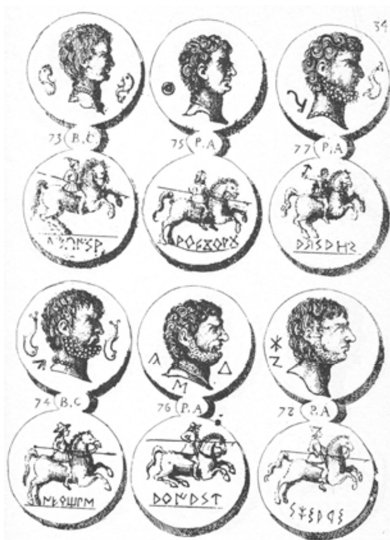
Figura 1. Lámina 34 de la obra de Vincencio Juan de Lastanosa, Museo de las Medallas Desconocidas Españolas , 1645, con moneda de arekorata (nº 75).