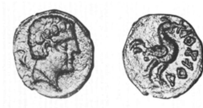
Figura 2. Divisor de arekorata procedente de los alrededores del pantano de Yesa (Almudena Domínguez, 1988, 252) de características similares al aparecido en Torrellas.