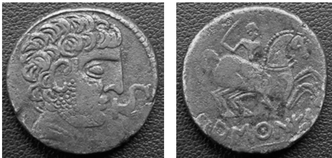
Figura 6. As de bronce de la ceca barscunes.