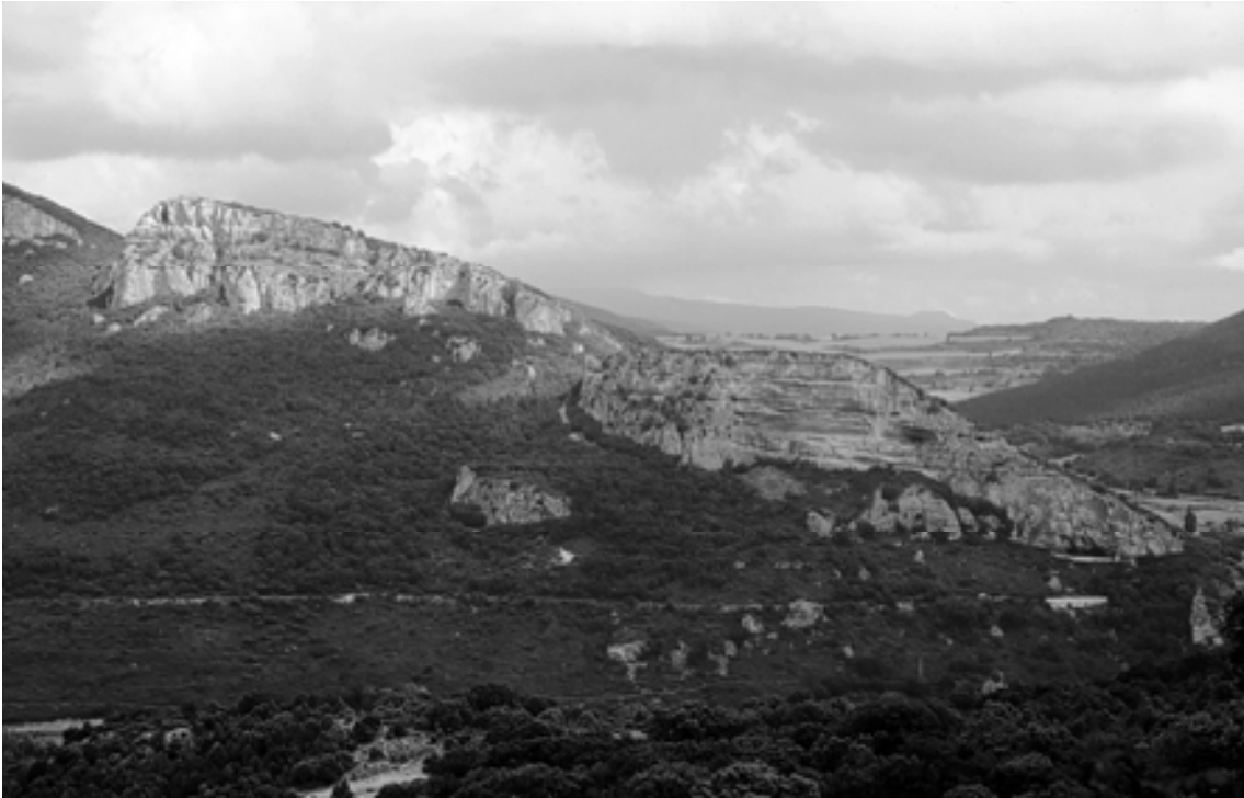
Figura 7. Vista desde el Oeste de las peñas de Altikogaña (izquierda) y Bardagorriá (derecha)

Con un diseño en planta más o menos triangular que ocupa unas siete hectáreas de superficie. Al igual que todos los castros que utilizan este modelo de emplazamiento, aprovecha como defensa natural de la parte occidental de su perímetro en dos de sus tres flancos el farallón rocoso de la peña que queda colgada sobre la vega del río Urederra, mientras que a oriente está defendido artificialmente por una muralla que se adapta a la topografía curva del terreno a la altura de la cota 675 m y que la recorre, de escarpe a escarpe, de norte a sur. Actualmente esta muralla se muestra a la vista como un simple talud de tierra cubierto por abundante vegetación, haciéndola casi imperceptible, lo que no es sino la fosilización del derrumbe de su estructura que, según vemos en un corte practicado por una de las pistas forestales abiertas en los años ochenta, se levantó con piedra caliza en aparejo de sillarejo asentado a hueso.