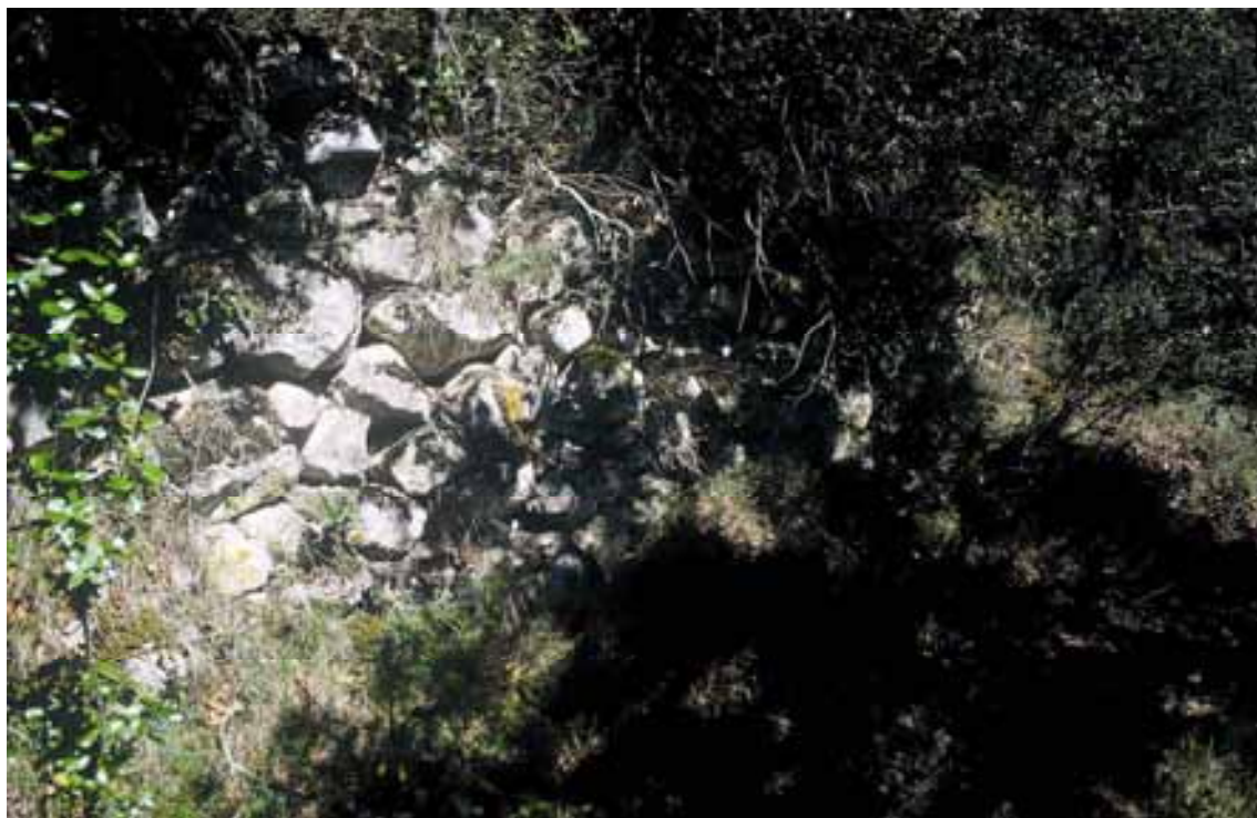
Figura 8. Detalle de uno de los muros con aparejo de sillarejo que abancalan el terreno del interior del castro.

Respecto a la estructuración interior de este hábitat que, recordemos, tiene una fuerte pendiente interior y una altitud relativa intramuros de unos 60 metros, necesariamente se habría resuelto mediante el abancalamiento artificial de la ladera con nueve muros de contención concéntricos levantados con piedra caliza local de sillarejo colocada a seco, que en algunos sitios se conserva hasta una altura de 180 cm., para conformar un caserío escalonado.