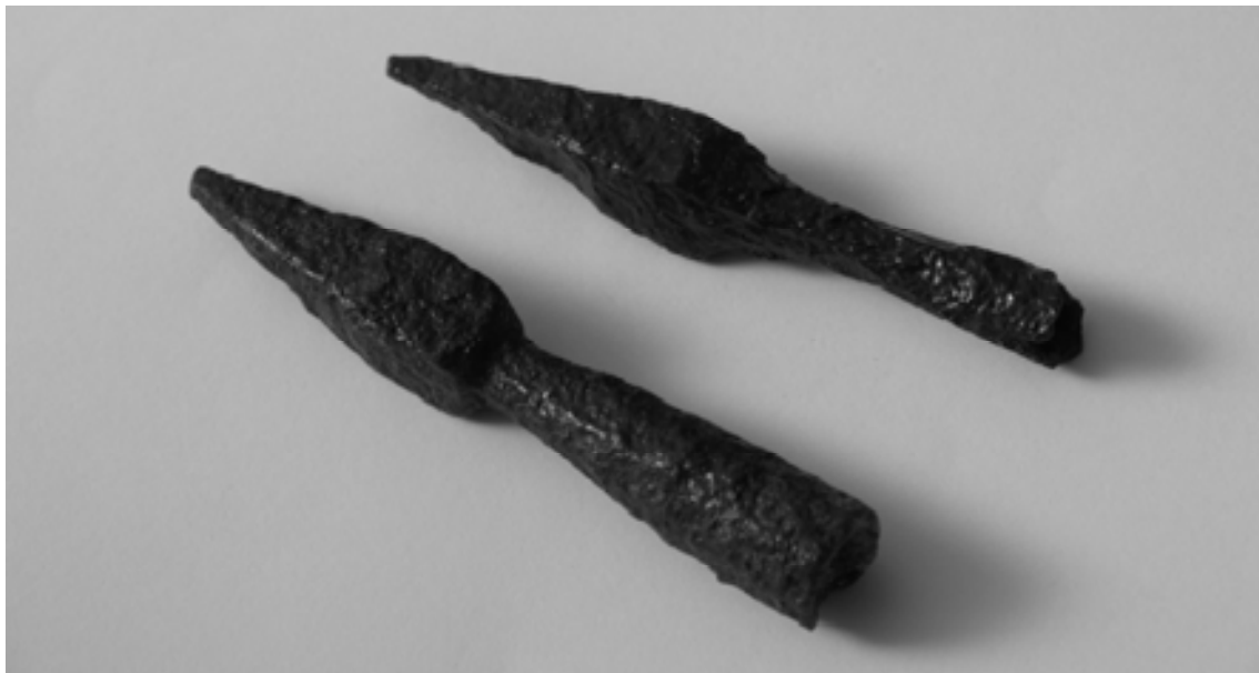
Figura 4. Dardos de catapulta romana en hierro tipo scorpio .

regatones en hierro y una nutrida representación de proyectiles de honda o glandes de plomo anepígrafos.