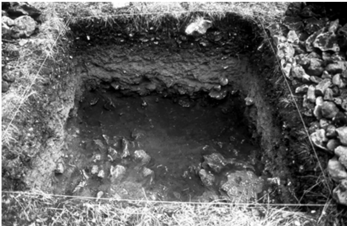
Figura 11. Vista de la cata realizada en el castro Peña Bardagorría.

Se realizó el correspondiente dibujo planimétrico de la planta de los distintos niveles así como de los dos perfiles más ilustrativos de la cata. Como es habitual en estos trabajos, la recogida de materiales y muestras se referenció tanto por los niveles naturales de la estratigrafía como por las correspondientes tallas o capas artificiales de excavación, en todos los casos con indicación de profundidad.