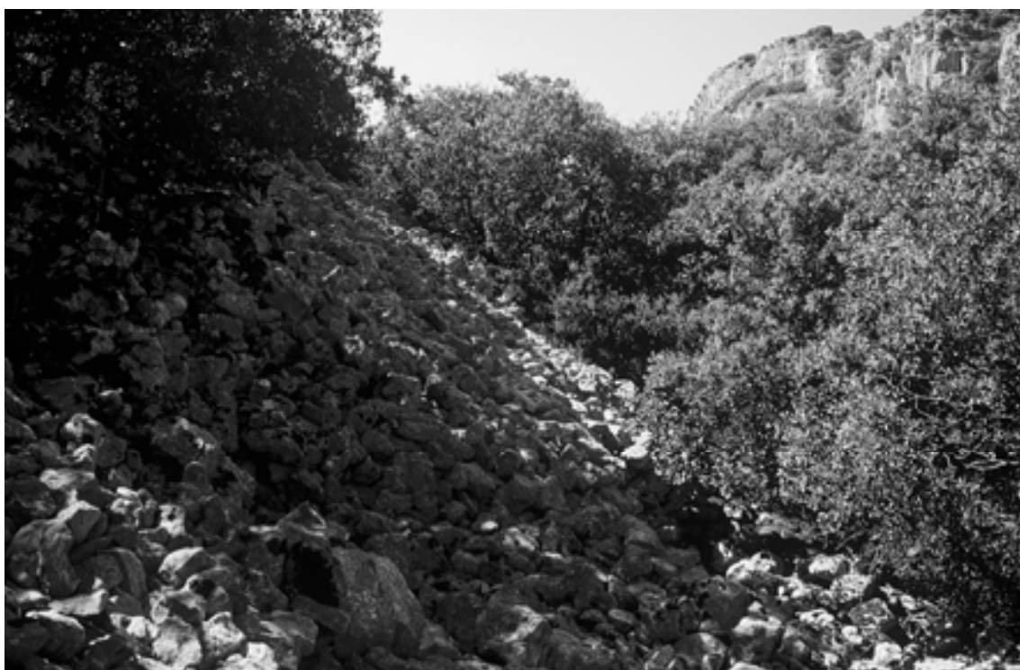
Figura 10. Primer plano del derrumbe de la muralla del castro de la Peña Bardagorría. Al fondo, el oppidum de Altikogaña en la peña del mismo nombre.

Este hábitat castreño ocupa la cima de un escarpe rocoso perteneciente al flanco occidental de un anticlinal colgado. Tanto a simple vista, tras una detallada observación directa del terreno, como en el estudio de la fotografía aérea ortogonal consultada (vuelos de 1956, 1967 y 1982) identificábamos el derrumbe de una muralla levantada con piedra caliza a seco en doble paramento con aparejo de sillarejo, que calculamos podría tener una anchura aproximada de 1,5 a 2 m.; recorre la peña, de un escarpe al otro, en una longitud aproximada a los 150 m.