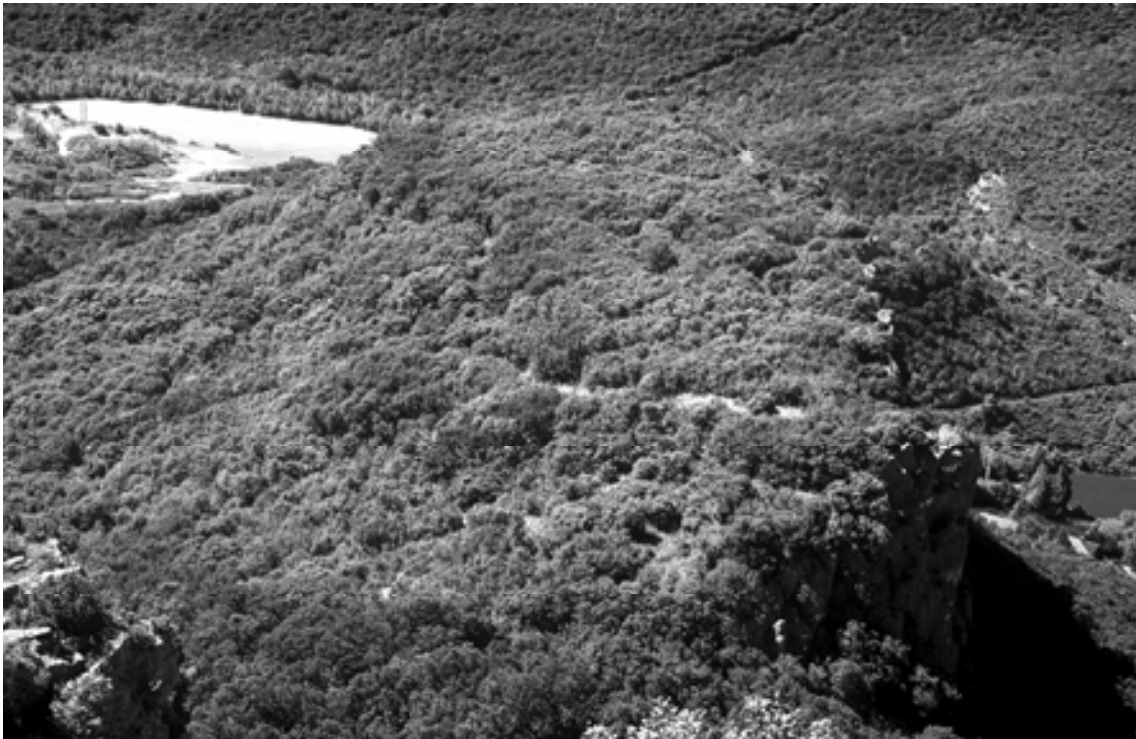
Figura 9. Vista tomada desde la peña Altikogaña del castro Peña Bardagorría. Obsérvese la línea blanca entre las encinas, que es el derrumbe de su muralla.

un pequeño castro inédito, dentro del mismo término concejil. Ocupa la primera de las llamadas “Peñas de San Fausto”, cuyo emplazamiento se sitúa al sur de Altikogaña (que es la segunda o central de las tres) pero a una cota inferior, conocida por los naturales del lugar con el nombre de Bardagorría . El recinto castreño se encuentra poblado de hermosos ejemplares de encinas centenarias y un variado catálogo de arbustos como sotobosque, lo que dificulta sobremanera el tránsito de personas por su perímetro y provoca una ausencia total de visibilidad del suelo, lo que hace que su prospección superficial sea infructuosa.