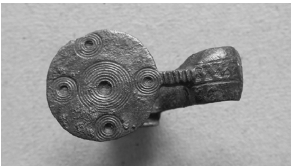
Figura 3. Detalle de fíbula en bronce con pie vuelto y cabeza de disco decorado con círculos concéntricos.

La apertura de unas pistas forestales en un terreno tan escarpado como la peña de Altikogaña obligó al Concejo de Eraul a realizar grandes movimientos de tierra, lo que hizo aflorar abundantes restos arqueológicos que estaban estratificados en el subsuelo, hecho que no pasó desapercibido para nadie. Sucintamente, entre el ajuar metálico recuperado en Altikogaña por el antiguo Grupo de Arqueología del Instituto, germen del actual Centro de Estudios Tierra Estella, destacan fíbulas de doble resorte (un fragmento), de pie vuelto con botón terminal y de La Tène con “cabeza de pato”, y otras más modernas, ya romanas, de tipos Alesia y Avcissa.