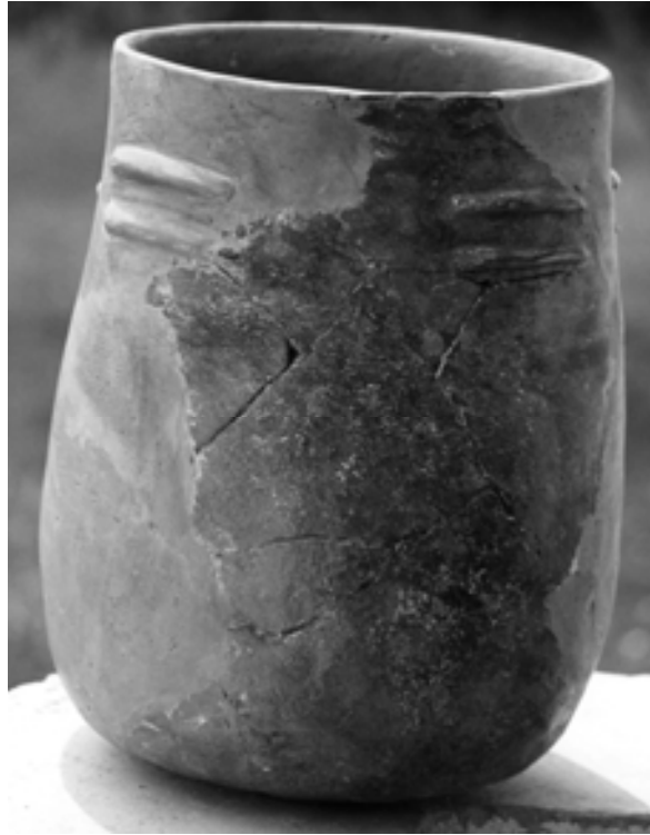
Figura 2. Vaso de cerámica hallado en la cueva de Lazkoa por el Aula de Arqueología del Instituto Oncinada de Estella.