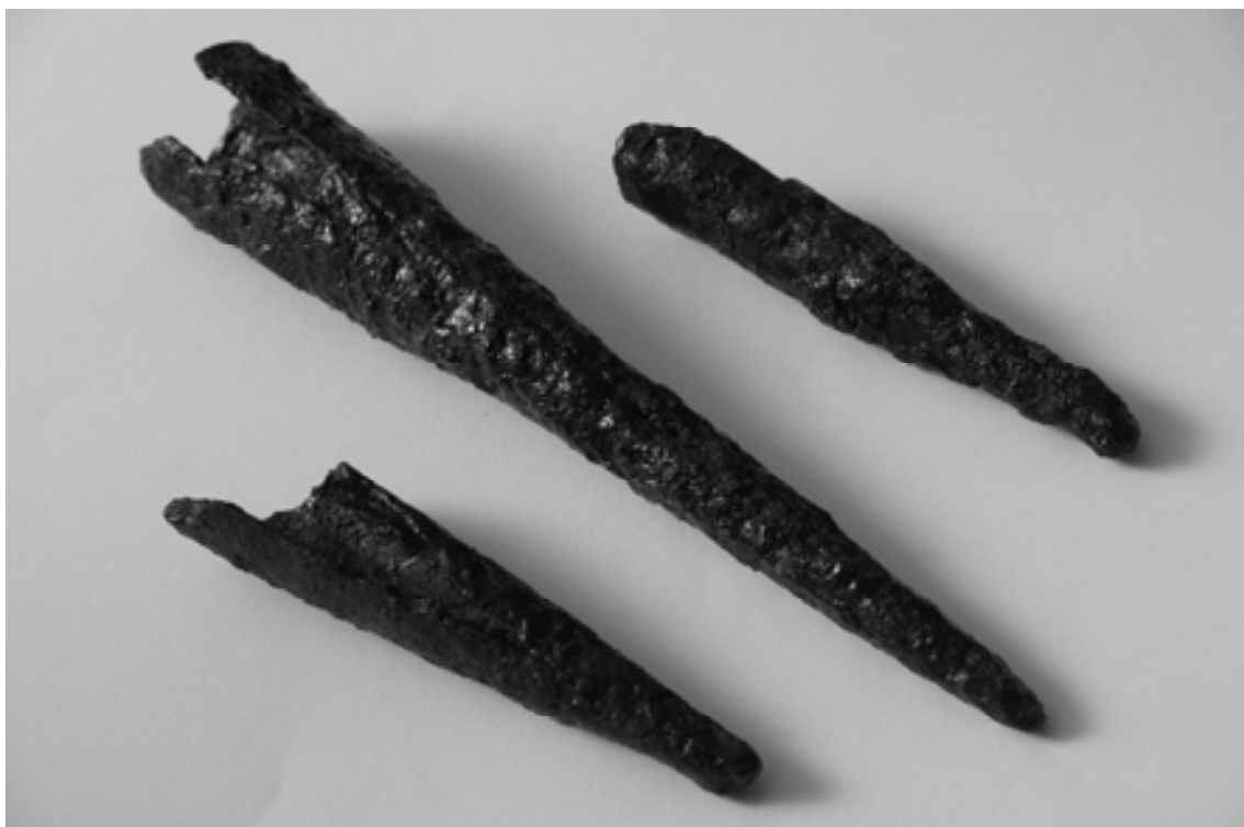
Figura 5. Regatones de hierro.

La prospección también permitió recuperar monetario ibérico acuñado por las cecas Barscunes (un as con leyenda de Bengoda y dos denarios, uno de