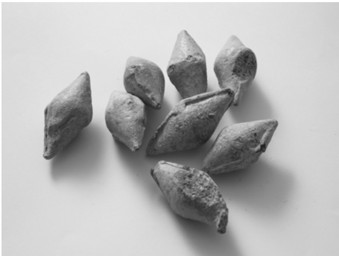
Figura 15. proyectiles romanos de honda anepígrafos, en plomo, recogidos en el oppidum de Altikogaña por el Aula de Arqueología del Instituto Oncineda.

Altikogaña, como ciudad que pudo haber acuñado su propia moneda en los siglos II y I a. C., desde su fundación jearquizó el territorio política, económica y comercialmente hasta la primera mitad del siglo I a. C., quizás complementándose en funciones con otros oppida de la comarca como el Pozo de la Mora, San Cristóbal de Guirguillano, Mauriáin y tal vez Murumendi (Armendáriz, 2008: n os 185, 165, 168 y 169 respectivamente del Catálogo), pues los materiales arqueológicos recuperados en el techo de su estratificación así parecen corroborarlo.