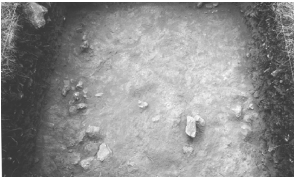
Figura 13. Detalle de las cuñas de poste exhumadas en un suelo de ocupación del castro Peña Bardagorria.

NIVEL II (65-100/130 cm.): formado por tierra color pardo, algo cenicienta, con algunos restos arqueológicos de cerámicas y huesos de animales y gran cantidad de piedras que en su base nivelan artificialmente el terreno. Es, en definitiva, la adaptación de una plataforma horizontal sobre la roca madre que buza naturalmente con fuerza al Este, por lo que posibilita la habitabilidad del sitio y la construcción de la vivienda identificada en el Nivel I.