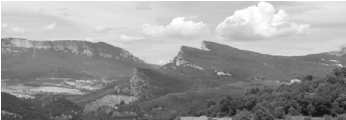
Figura 1. Vista desde el Sur de las "Peñas de San Fausto", llamadas de mayor a menor Lazkoa, Altikogaña y Peña Bardagorría. A la izquierda la sierra de Santiago de Lóquiz.

A comienzos de los años ochenta el equipo del Aula de Arqueología del antiguo Instituto Oncineda de Estella, dirigido por profesores del Departamento de Historia, procedió al estudio de las llamadas "Peñas de San Fausto" ubicadas entre los términos concejiles de Eraul (Yerri) y Larrión (Allín).