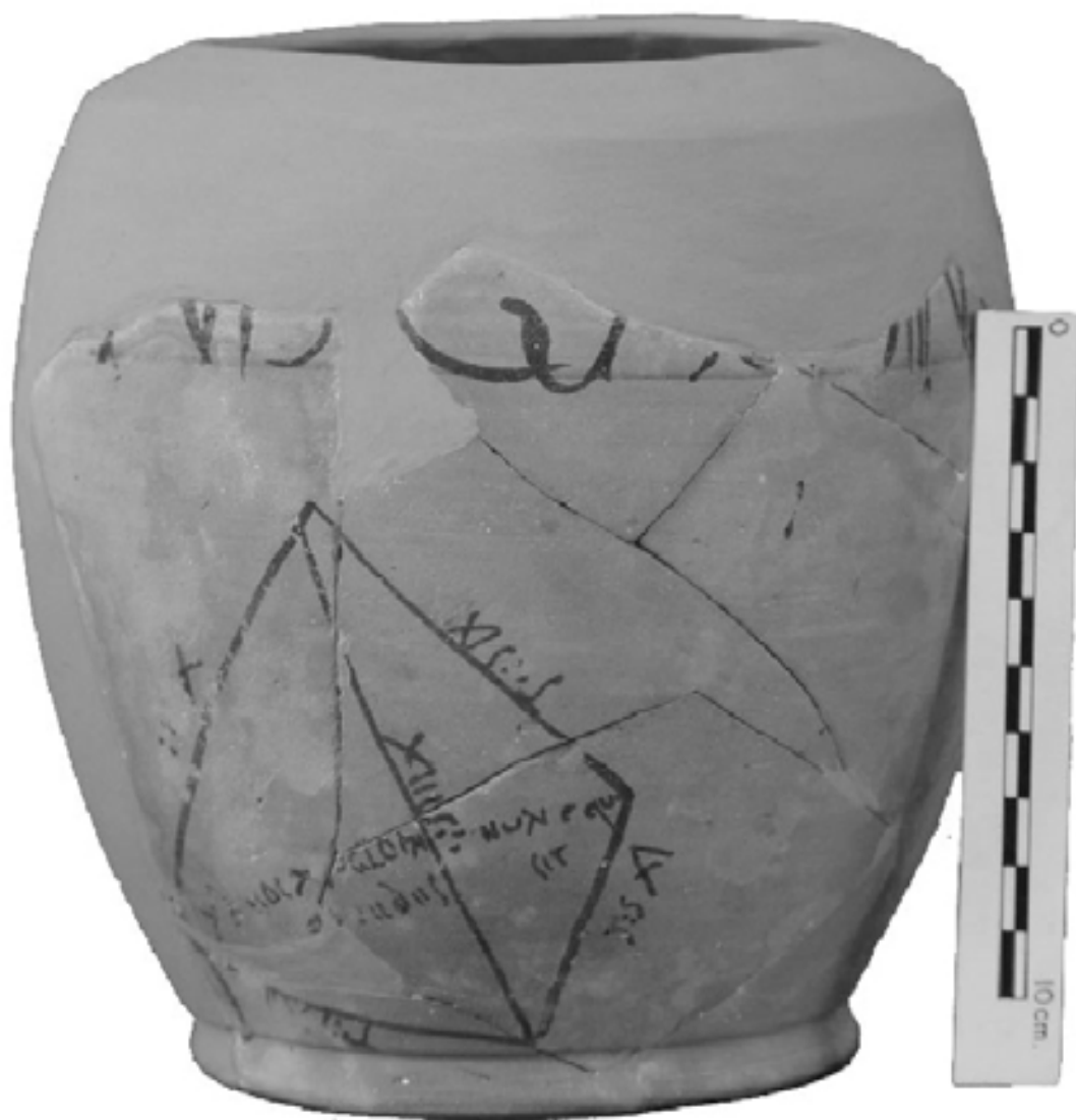
Figura 1. El vaso, tal y como está actualmente tras su última reconstrucción.