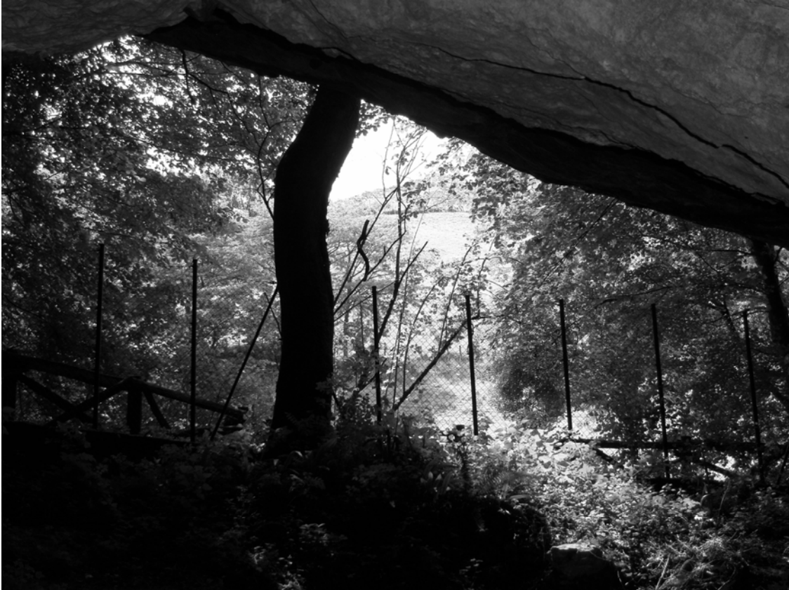
Figura 3. Vista desde el interior de la cueva de Berroberría hacia la ladera exterior de pradera en pendiente.

de su umbral, el acceso a espacios interiores. Así sus primeros ocupantes magdalenenses 3 la percibieron como muy espacioso y cómodo abrigo: de suelo ocupable de no menos de 200 m 2 , bien orientado hacia el sur, dotado de suficiente luz natural y junto a corrientes regulares de agua.