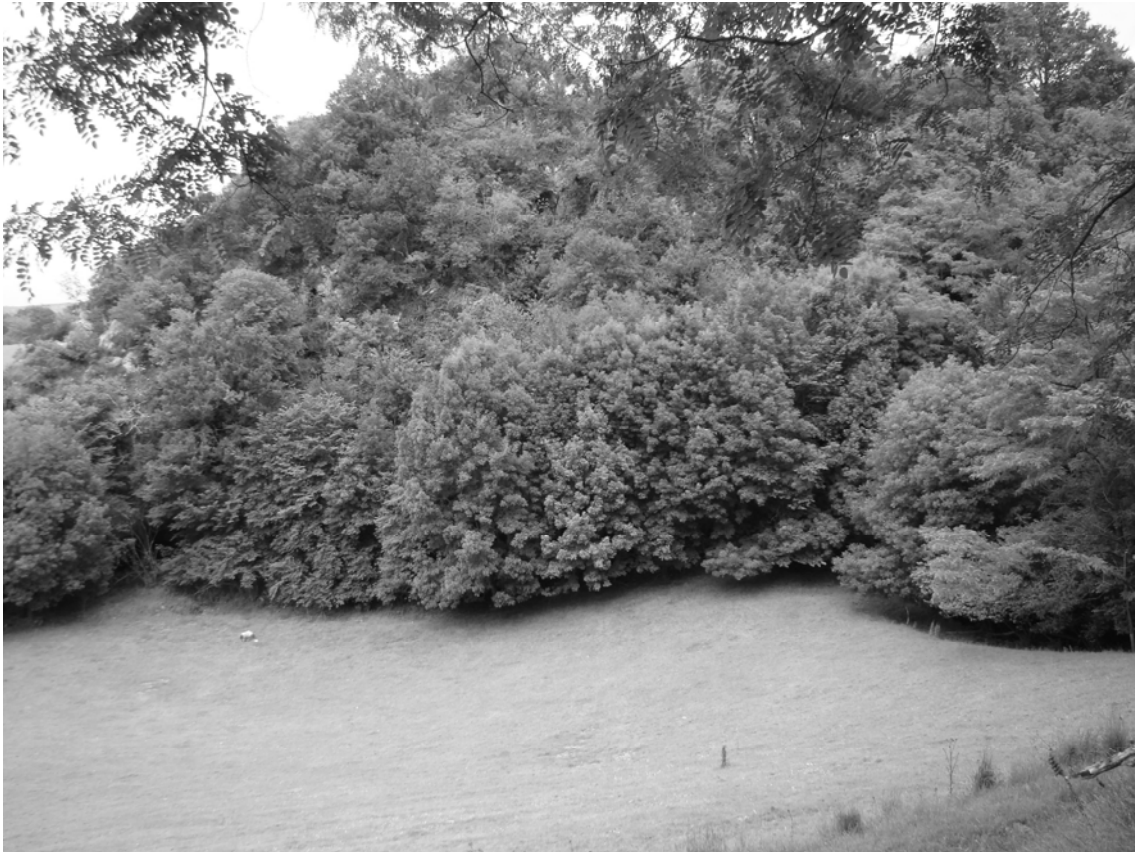
Figura 2. Vista del macizo calizo de Celayeta/Berroberría (montículo calizo cubierto de bosque: donde se abren las cuevas de Alkerdi y Berroberría) y la ladera triásica frontera (pradera en pendiente).

Para determinar los tiempos en que se produjeron las ocupaciones prehistóricas de Alkerdi y Berroberría hay que servirse de referencias cruzadas de interpretación cronoclimática (estratigrafías, registros de arqueozoología y arqueobotánica), de reconocimiento cultural (industrias) y de dataciones absolutas. No podemos agotarlas, pues no se ha concluido el estudio de todas las perspectivas multidisciplinarias en ambos yacimientos.