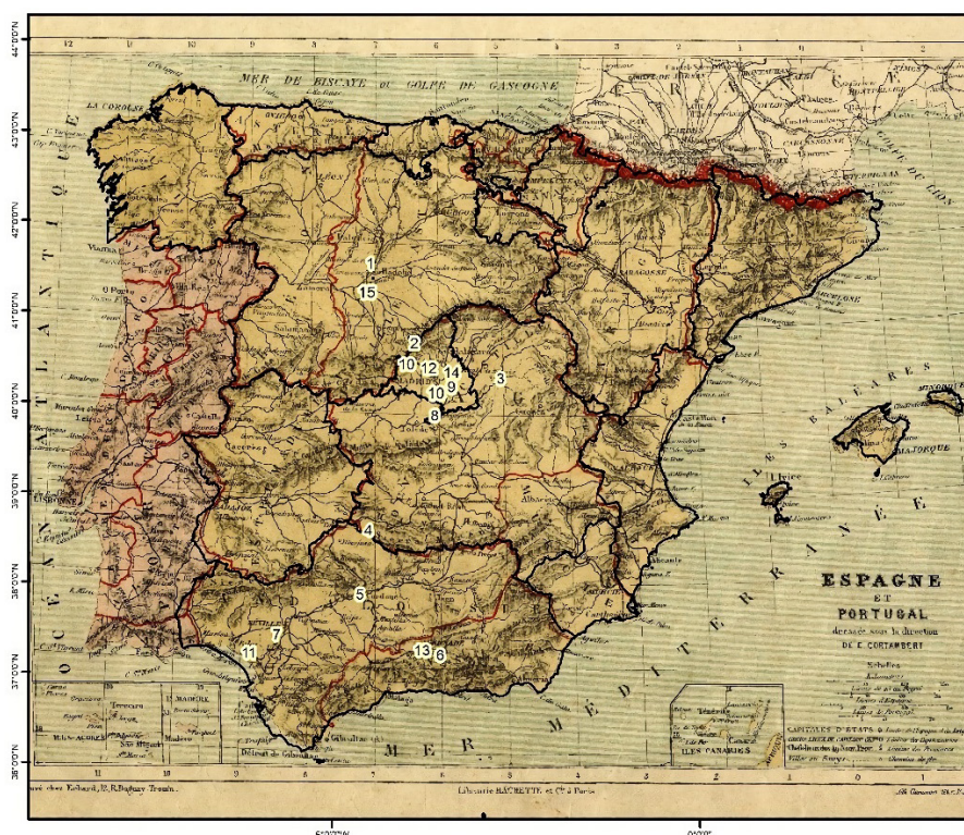
Mapa I. Real Patrimonio en la antigua Corona de Castilla a principios del siglo XIX