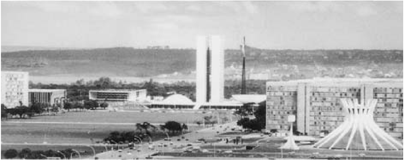
Fig. 2. Brasilia. (1956-..). Imagen general del eje principal y el complejo del Capitolio.

deos que habían aplanado el territorio urbano y esperaban que algún terremoto se encargara de hacer desaparecer los execrados centros metropolitanos aún en pie. Y allí donde era posible propiciaban la creación ex novo de ciudades perfectamente ordenadas y previsibles. Brasilia en América Latina (fig. 2) y Chandigarh en la India (fig. 3) son los ejemplos más conocidos de este desideratum 8 .