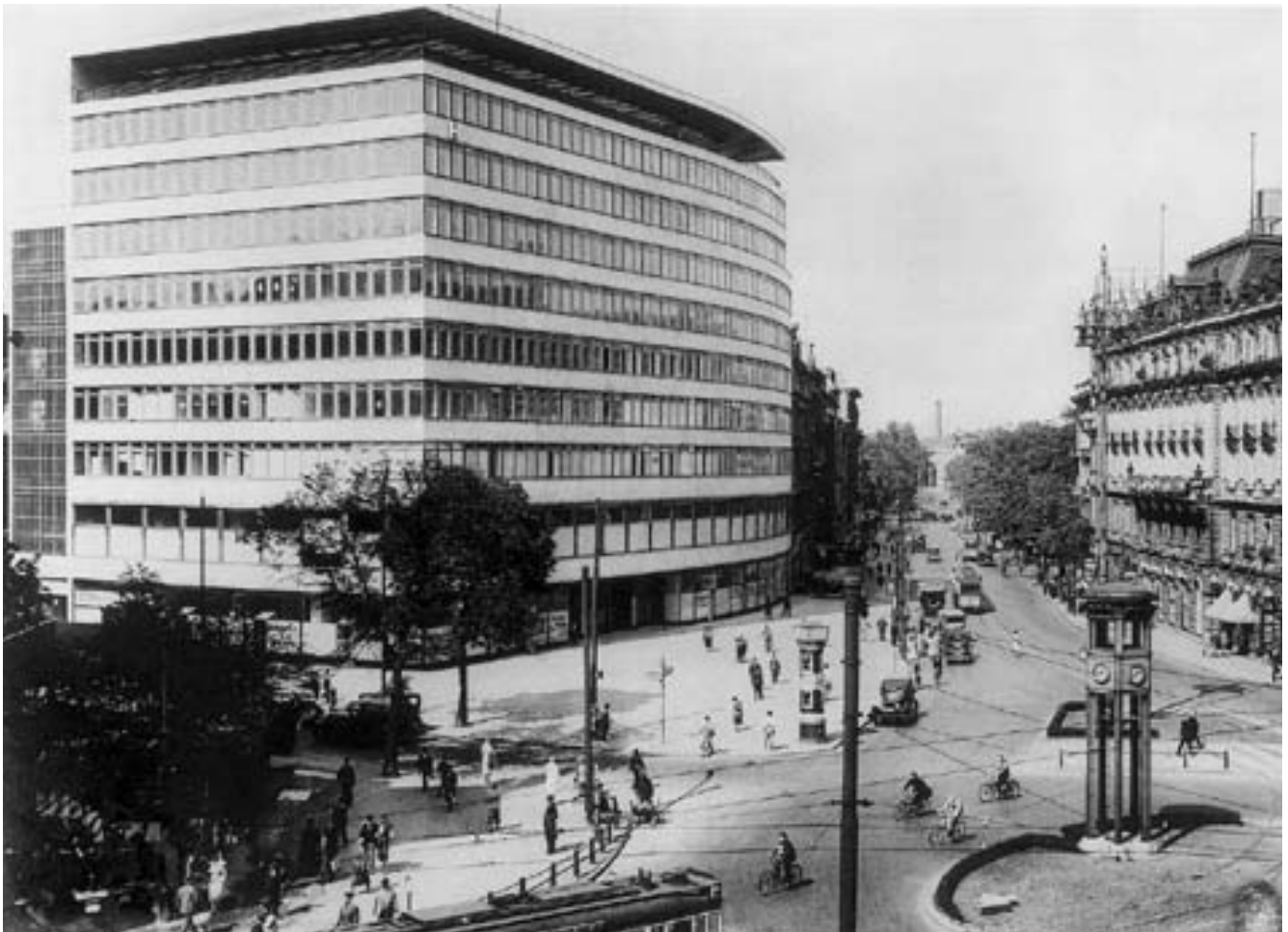
Fig. 4. Postdamer Platz. Berlín. A la izquierda, la Columbus-haus , (1930-1932) de Erich Mendelsohn.

produce en sentido contrario: siguiendo las premisas del análisis de Simmel, sin “afuera” sobre el que proyectarse y del que recibir energías, contradicciones y estímulos, la nueva condición dispersa debería conducir a un creciente empobrecimiento.