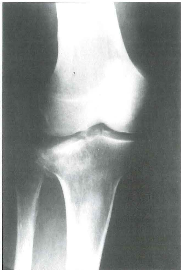
Varón de 54 años. Caída desde 3 metros. Fractura del platillo tibial externo. Radiografía AP.

articular. La fractura proximal de tibia tipo B3 presenta hundimiento articular y fractura de la cortical externa. En la radiografía antero-posterior se distingue un ensanchamiento de la meseta tibial, y en la radiografía de perfil, se detectan los desplazamientos en el plano sagital de la zona de hundimiento articular, ya sea anterior o posterior (10). En ocasiones una tomografía lineal de la fractura puede ayudar a delimitar correctamente el trazo de la misma.