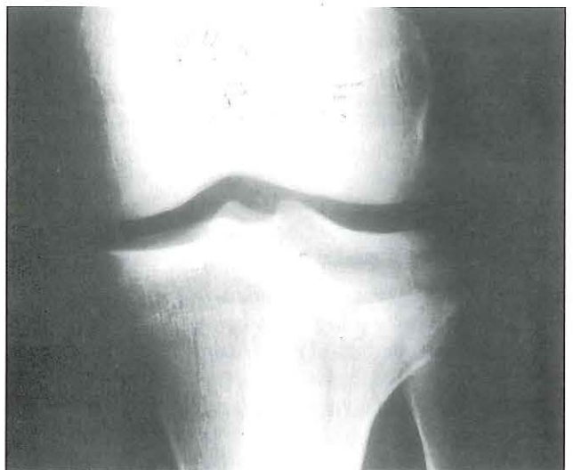
Varón de 19 años. Accidente de tráfico. Fractura del platillo tibial externo. Radiografía AP.