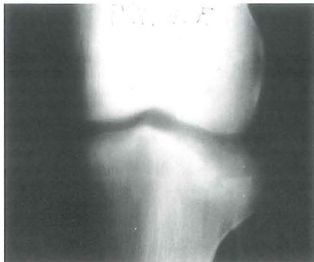
Paciente de la figura 1. Tomografía lineal en la que se aprecia el hundimiento del platillo tibial.

hueso ilíaco, si bien se pueden utilizar la tibia, el peroné, cóndilos femorales u otras zonas en casos más concretos (olécranon, metáfisis distal del radio, etc..) (1,5,6).