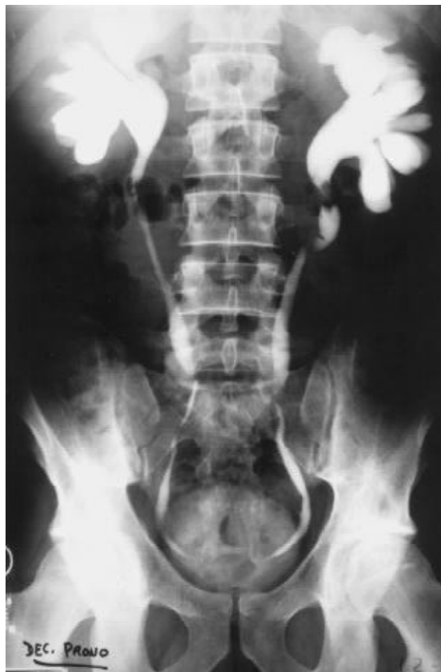
Figura 1. UIV. Defecto de repleción en uréter proximal de ambos riñones. Dilatación de ambos sistemas ureteropielocaliciales y de los 2/3 proximales de ambos uréteres

urinario en el tratamiento de estos pacientes. A pH 3,5 o menor la solubilidad del Indinavir es mayor de 100 mg/mL. Experimentos in vitro demuestran como la utilización de soluciones ácidas disuelve las incrustaciones de Indinavir de los catéteres ureterales 14 . A partir de esto se considera la utilización de sustancias ácidas como el ácido Ascórbico para acidificar la orina de los pacientes con cálculos de Indinavir. Sin embargo la acidificación a niveles de pH igual o inferior a 5 es extremadamente difícil de conseguir y mal tolerada 27 , e incluso puede ser peligrosa para el paciente al favorecer la precipitación de ácido úrico sobre todo en aquellos casos en los que se asocia hipocitaturia, tan frecuentemente demostrable en pacientes con cálculos de Indinavir 25 .