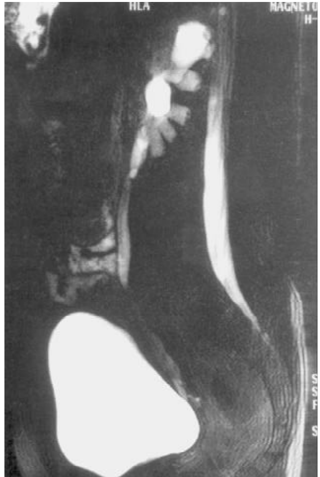
Figura 3. Uroresonancia. Se observa un defecto de repleción hipointenso de 1,5 cms de diámetro máximo en el uréter proximal izquierdo inmediatamente distal a la unión pieloureteral.