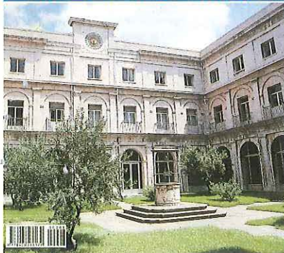
Patio del edificio central de la Universidad.