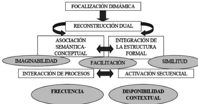
Modelo multifactorial del procesamiento léxico

tantemente alterada por la participación de la memoria episódica para acabar determinando la memoria semántica, más estable, en virtud de la experiencia repetida. Desde la perspectiva de la comprensión léxica, parece evidente que el significado no puede concebirse como una entidad encapsulada sino como una red dinámica derivada de un proceso de construcción semántica en el que influyen tanto aspectos lingüísticos como extralingüísticos. Se trata de un conjunto de rasgos discretos que pueden ser activados con mayor o menor intensidad en función de los contextos y en virtud de los procesos atencionales desencadenados en cada contexto.